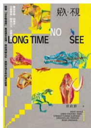
蔡政修著 麥田出版， 本館索書號： 359.5/4412/2024

《好久·不見》是一封寫給時間與土地的邀請函。古生物學家蔡政修以「古生物偵探」的身分，帶領讀者走進臺灣的山林、海岸與化石現場，尋訪那些曾在這片土地上生活，卻早已消失的生命。書中出現的露脊鯨、劍齒虎、古菱齒象、鳥類恐龍，不只是遙遠名詞，而是一段段與臺灣緊密相連的演化故事。